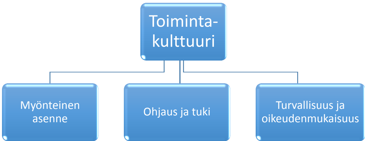
Kuvio 2. Kyrönmaan lukion toimintakulttuuri

Edellä mainittujen lisäksi lukion toimintakulttuuria luo ja koulun toiminnassa on mukana yrittäjämäinen toimintatapa . Yrittäjämäinen toimintatapa nousee lukion opetussuunnitelmaan ja toimintakulttuuriin uudesta perusopetuksen opetussuunnitelmasta (ops), jossa se on koko Etelä-Pohjanmaan yhteisen ops :n yksi painotusalue. Maakunnallisen perusopetuksen opetussuunnitelman (2016) mukaan yrittäjämäinen toimintatapa pitää sisällään innovatiivisuuden, hallitun riskinoton sekä tavoitteellisen toiminnan. Yrittäjämäisesti toimiva ihminen uskaltaa ottaa uusia askeleita, vaikka niissä voisi epäonnistuaakin. Yrittäjämäiseen toimintaan liittyy myös vastuullinen suhtautuminen kaikkeen tekemiseen sekä oman itsen tavoitteellinen kehittäminen.